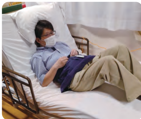
ベッドギャッチ体験研修