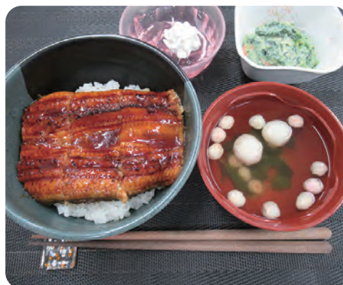
土用の丑の日には鰻丼を提供