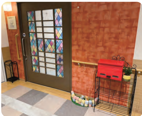
ユニットの入口を玄関風に装飾

馴染みの職員や仲間に関われ、最期までその人らしく過ごせる空間をつくるため、施設全体での試行錯誤と挑戦は続いていく。