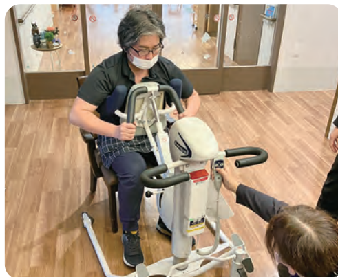
排泄サポートリフト体験