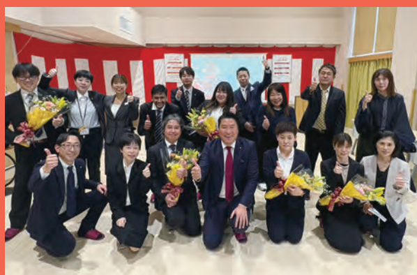
C1グランプリ2026 出陣式(4月6日)