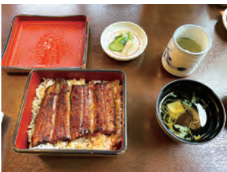
埼玉旅行では老舗のうなぎ店「うらわのうなぎ 萬店」へ (2025年8・9月)

車両手配もパズルのようなものです。リフト付きバスの手配から、参加者の状態に合わせた介護タクシーの組み合わせまで、出発の2週間前に名簿が確定してから、最適な移動手段を組み上げます。これも画