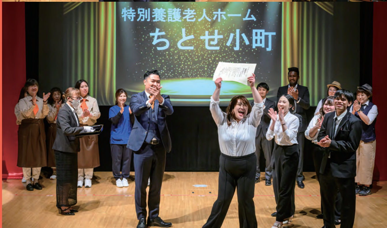
C1グランプリ2025 最優秀賞のちとせ小町