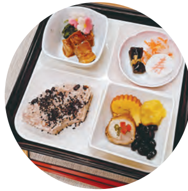
元日の昼食は重箱に入れたおせち料理です

食事だから安価や手づくりのものでいい」という甘えを捨て、施設の外と同じ、あるいはそれ以上の驚きと本物を提供したいと考えています。お正月の重箱おせちもそうです。蓋を開けた瞬間の「わあっ」という歓声、それが私たちの原動力です。