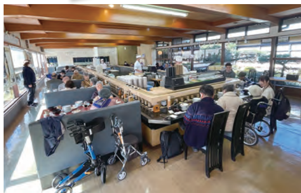
茨城・大洗でお寿司をいただきました (2025年12月)