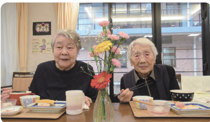
お寿司を食べてニコリ

食を通じて、お客様の毎日に彩りと笑顔をお届けすること。それが、私たちの揺るぎない使命です。