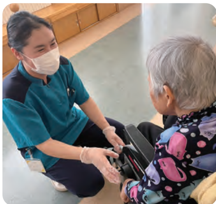
一人ひとりと向き合う

い切ってやってほしい。この経験は必ず自信になり、どこへ行っても活躍できる人材への成長につながる」と背中を押す。チーム一丸で困難を乗り越えた三山園が語る「変化の軌跡」と、今後の飛躍に大いに期待したい。