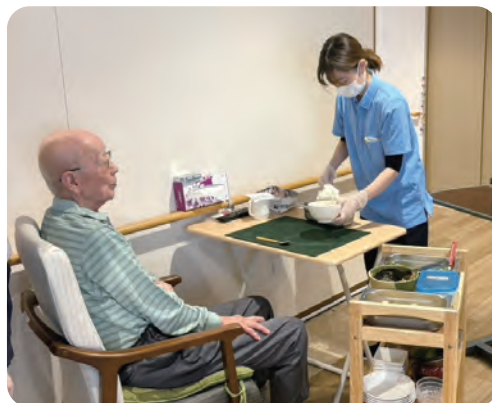
ご希望に合わせてご飯の量を調整