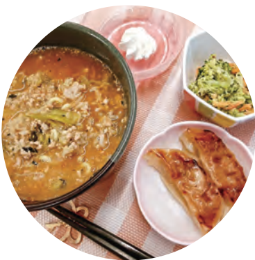
担々風味ラーメンと餃子のセットを出すことも

私たちは千葉県の米農家と直接契約を結び、年間40トンのお米を確保しています。この取り組みは、左理事長の「お客様の口に入るものに責任を持ちたい」「お米を自給自足できる体制を整えたい」という想いから始まりました。やわらかく炊いてもお米本来の甘みと旨味をしっかりと感じられる、非常に美味しいお米です。また、昨年の秋の収穫時には左理事長自らがコンバインを操縦し、稲刈りを行いました。この行動には、左理事長の食への責任に対する強い意志が込められています。実はこのお米、『いきいき暮らし』