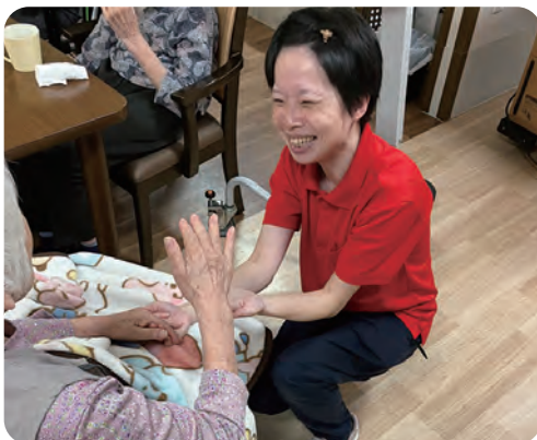
お客様とにこやかに交流

変化できた姿を全力で伝えます」と力強く語ってくれた。リスクを恐れず、開かれた施設へと歩み続けるちとせ稲毛の挑戦から目が離せない。