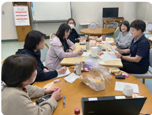
C1 に向けて会議中の皆さん

も事業所全体で技術を高め、より多くのお客様を支えていく方針だ。制度の壁にぶつかりながらも、一丸となって利用者の生活を守り抜く真摯な姿勢は、まさに介護の原点と言えるだろう。