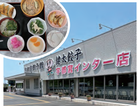
栃木で宇都宮餃子館と道の駅散策 (2025年5月)