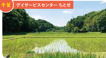
千葉 デイサービスセンター ちとせ

遠くの桜の木や、白井駅の方、天気の良い日は筑波山が見えます。雨が降った後の畑はキラキラしてとても綺麗です。昼食を食べながら、「筑波山が見える」とひそかに楽しんでます。ケアハウスちとせは高台にあるので、何年前の大台風の時もびくともしませんでした。眺めがいいのももちろん、安心して住んでいただける場所なんです。