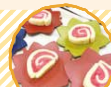
目でもおいしい! 和のカステラ 「二色浮島」