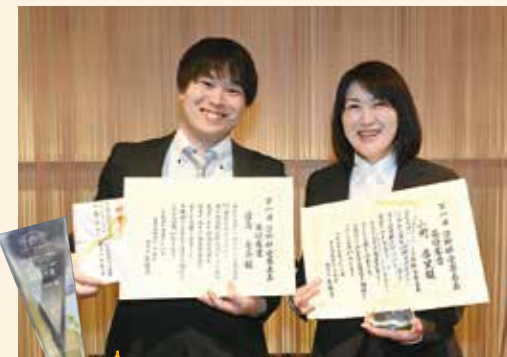
最優秀賞のお二人には、後日トロフィーが贈られました。