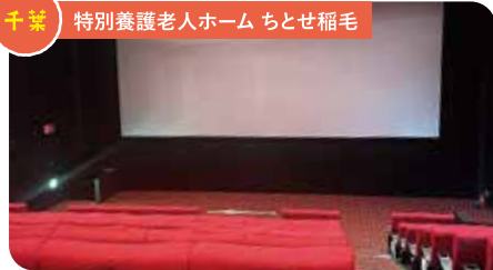
千葉 特別養護老人ホーム ちとせ稲毛

撮影時は、田植えを終えたばかりなので、水面には周りの景色が映ってますね。風景も素敵ですが、車の窓を開けると……晴れた日には、右側からキジが「ケン」と鳴き、左からは鶯が「ホーホケキョ」。たまに姿を見せてくれる時もある、その時は大興奮です！雨の日や夕方には、田んぼでカエルの大合唱も。