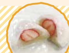
春限定! 白あんが上品な味を演出 「いちご大福」