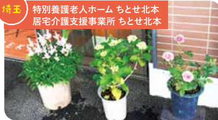
埼玉 特別養護老人ホーム ちとせ北本 居宅介護支援事業所 ちとせ北本

結構、ジャンル問わず、アニメから、時代劇、アクションもの、ミュージカルなど、自分が面白そうだなと思った作品は映画館で観ています。映画館の環境って、作品に入り込めますよね。ストレスも発散できます(^_-)-☆