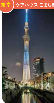
東京 ケアハウス こまち墨田館

地域の皆様が毎回花を植え替えて来てくださいます。今回はこのお花たちです。先日は、地域の方がミカンの木を3本植えてくださいました。秋には食べごろを迎えるので、お客様自身に抱いてもらおうかと考えている今日この頃です。