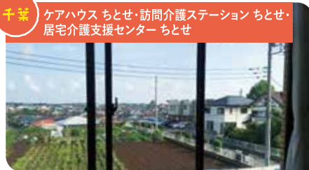
千葉 ケアハウス ちとせ・訪問介護ステーション ちとせ・居宅介護支援センター ちとせ

お天気で気持ちいい日は、昼食後の飲み物をこちらで召し上がる方もいらっしゃいます。季節のお花を見ながらゆっくり過ごされ喜んでいただいています。そして、テラス横には畑&庭があります。皆さんと収穫し、手作り昼食やおやつで食べられるようにお野菜を育てています。