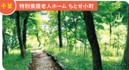
千葉 特別養護老人ホーム ちとせ小町

全部で11の事業所がある千歳会。各チームがブログで日々の情報発信に取り組んでいます。今回のお題、どんな場所が出てくるのでしょうか？