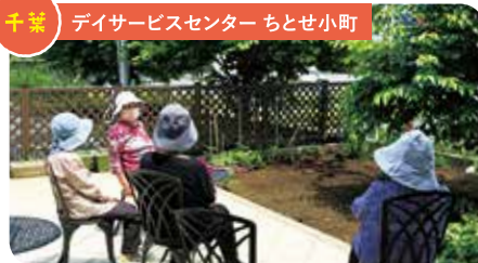
千葉 デイサービスセンター ちとせ小町

「白銀ニュータウン入口のバス停」付近から一帯に広がる「大蛇里山」です(^▽^)/ 散歩をしてみると、里山のほうから「ちとせ小町」が見えます。木漏れ日がとても気持ちいい〜。頂上まで行くと、休憩場所があります！施設見学と合わせて、ぜひこの里山にも行ってみてください。