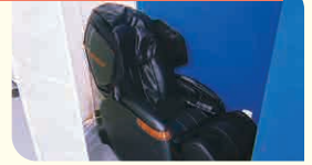
特別養護老人ホーム ちとせ北本