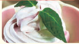
デイサービスセンター ちとせ