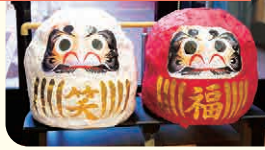
特別養護老人ホーム ちとせ稲毛