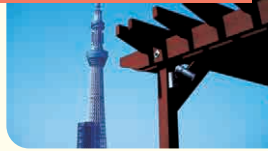
ケアハウス こまち墨田館