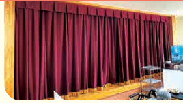
ケアハウス ちとせ・訪問介護ステーション ちとせ・居宅介護支援センター ちとせ