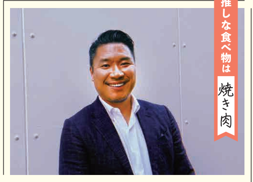
推しな食べ物 は 焼き肉

この『アサキ』は、職員たちがチャレンジできるメディアになってほしいですね。こんなひとに会いたいとかやってみたいという、アイデアを出して実行できるような。そのためにも、法人内の改革に取り組んでいます。みんなが楽しく、安心して過ごせる法人をつくるので、もうすこしおつきあいをお願いします。