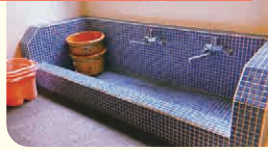
特別養護老人ホーム ちとせ小町